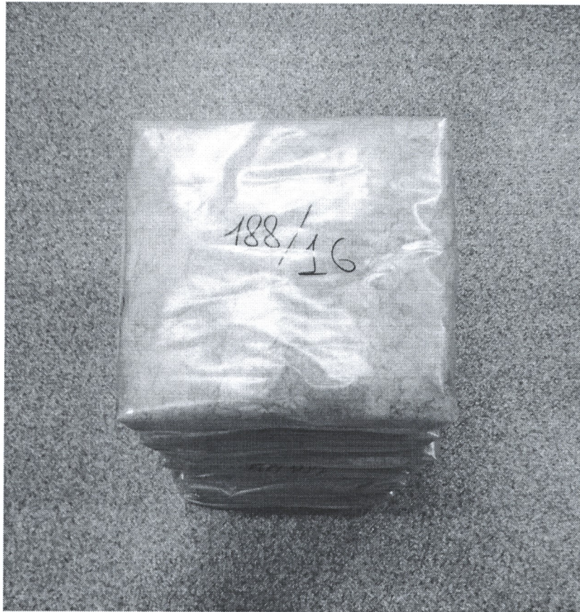
Рисунок 2 – Випробувальні зразки дослідів

15. Тип та основні характеристики випробувального обладнання та засобів вимірювальної техніки, за допомогою яких фіксувалися параметри оточуючого середовища під час випробувань, наведено в таблиці 2.